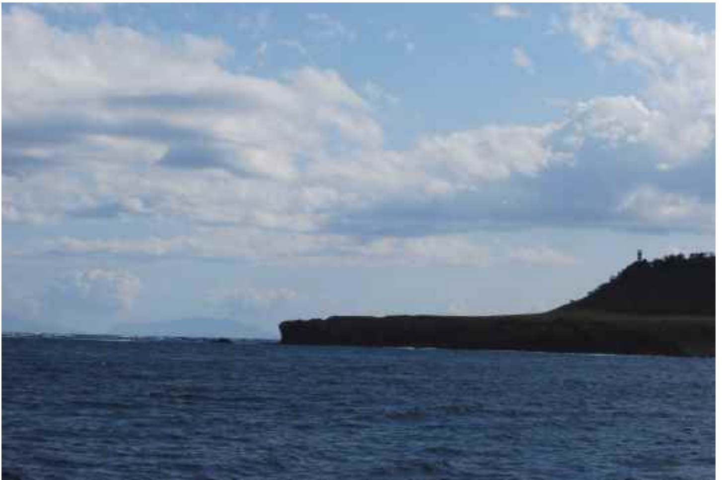
知床半島（知床岬） うっすら国後島が望めます