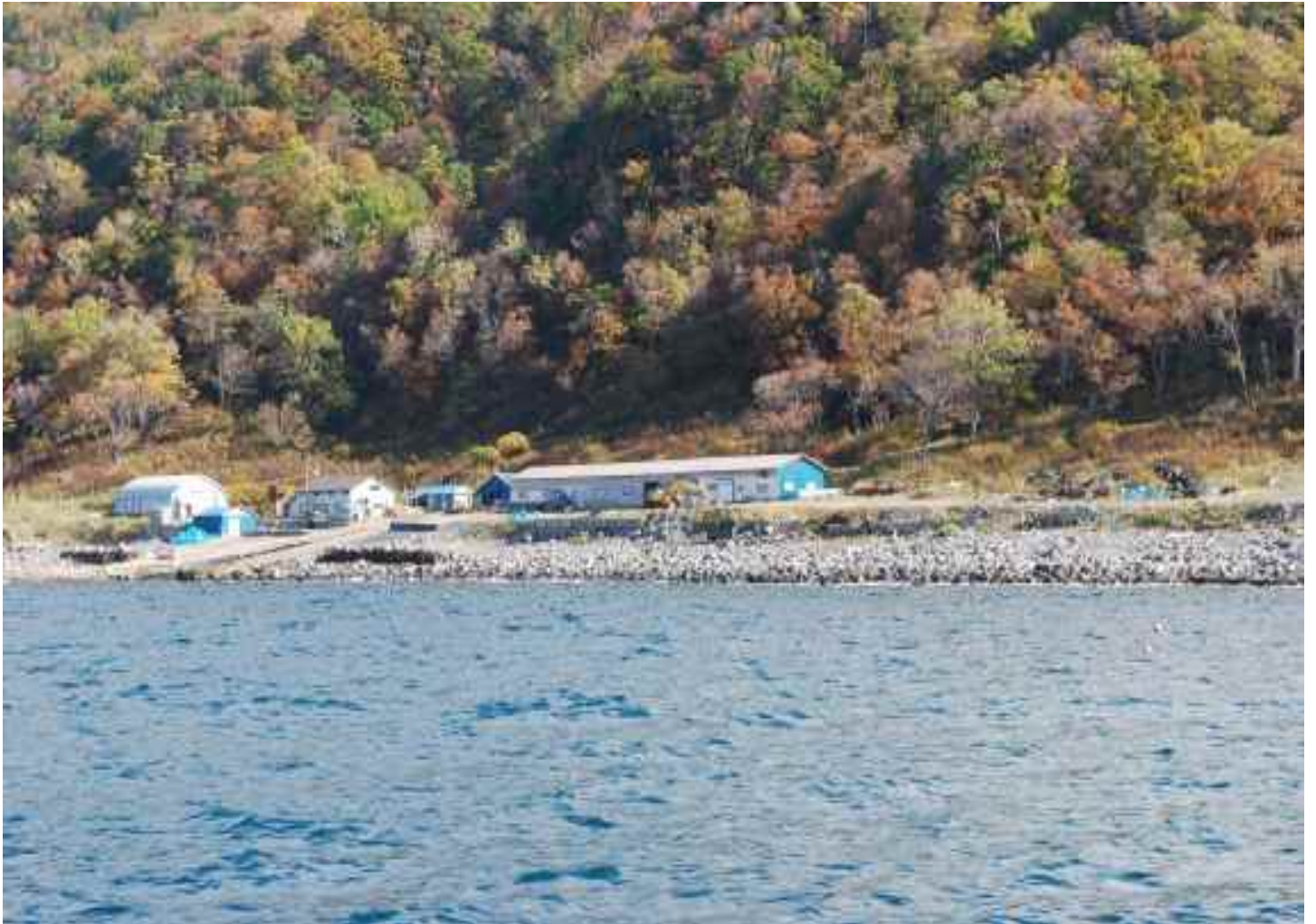
ルシヤ地区の番屋